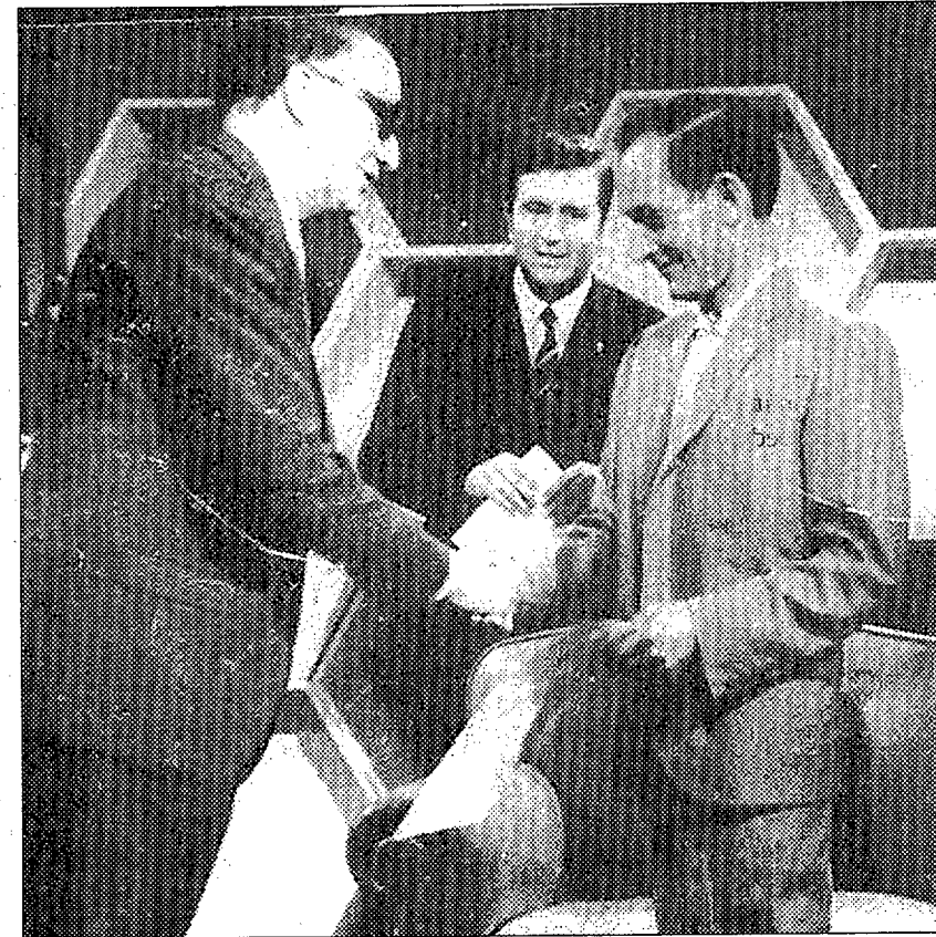
En TVE recibiendo un primer al mejor cortometraje